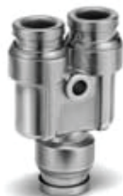
Złączka - typ Y