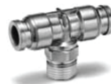
Przyłączka - typ T