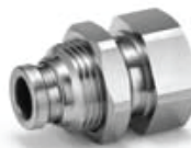
Przyłączka grodziowa z gwintem wewnętrznym