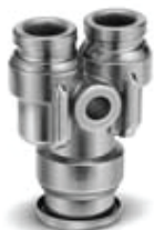
Złączka rozgałęźna redukcyjna - typ Y