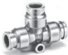
Złączka rozgałęźna redukcyjna - typ T