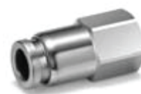
Przyłączka prosta z gwintem wewnętrznym